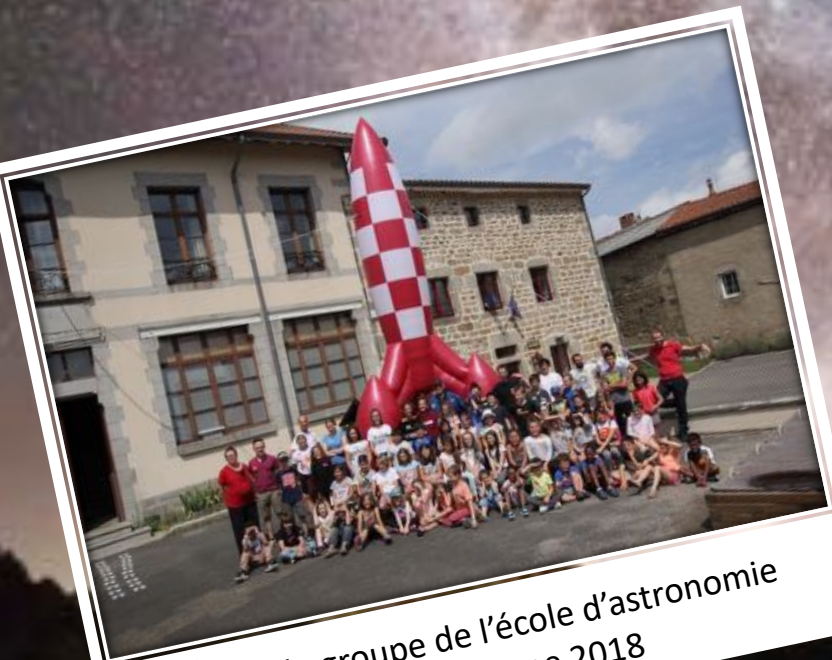
Photo de groupe de l'école d'astronomie d'Astr'Auvergne 2018