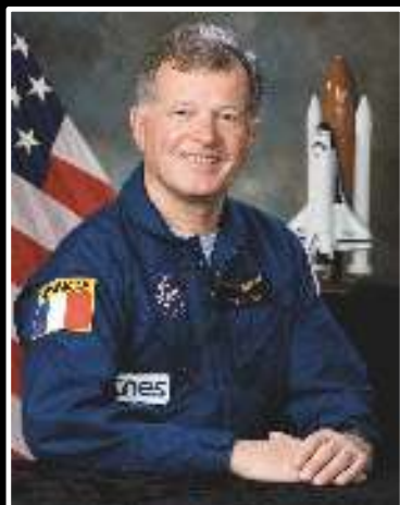
Jean-Loup Chrétien Premier astronaute français